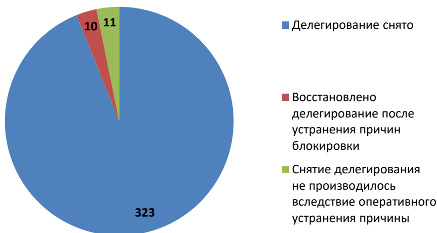
Рис.3 Итоги обработки обращений о снятии делегирования (март 2018)

За отчетный период по обращениям компетентных организаций были сняты с делегирования 333 доменных имени. Для 11 доменных имен снятие делегирования не потребовалось вследствие оперативного устранения причин блокировки администратором домена (или ресурс был заблокирован хостинг-провайдером).